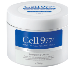
에너지이징 크림 500g