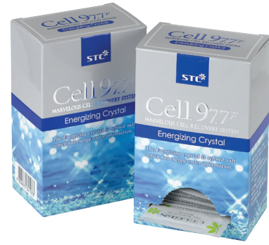
에너지이징 크리스탈 2g×30ea