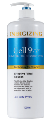
이펙티브 바이탈 솔루션 1000ml