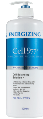
셀 밸런싱 솔루션 (-) 1000ml

pH밸런스를 조절해 피부장벽을 강화시키고 풍부한 수분을 공급하는 +이온 토너