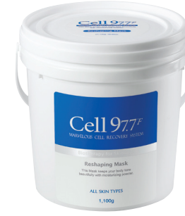
리세이핑 마스크 1100g