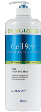
퓨어 프레시 솔루션 1000ml

과다 피지 조절 및 트러블 진정에 효과적인 특히 받은 이펙티브 팩터가 함유된 토너