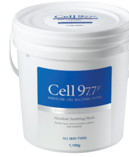
엡솔루트 수딩 마스크 1100g