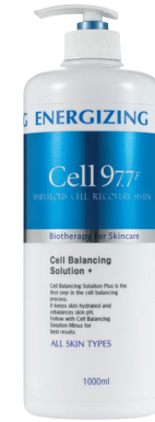
셀 밸런싱 솔루션 (+) 1000ml

pH밸런스를 조절해 피부장벽을 강화시키고 풍부한 수분을 공급하는 +이온 토너